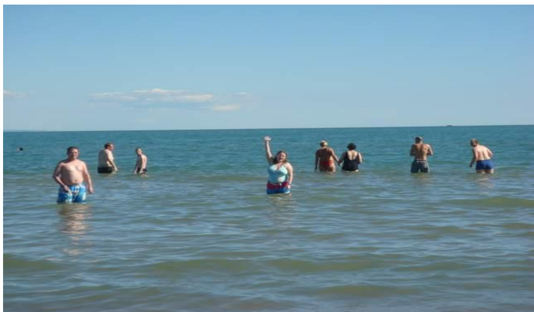
Knittelfeld, am 28.09.2010